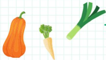
TABLEAU DES TEMPS DE CUISSON DES LÉGUMES